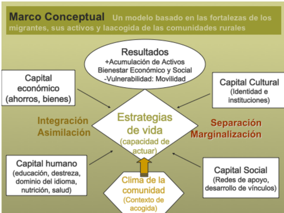
Figura 1. Diagrama del marco de capitales y clima de acogida en las estrategias de vida